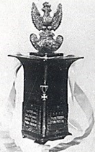
Urnę z prochami z pol bitewnych 2 p.p. Leg. złożoną w klasztorze na [Kisnej] Górze w Ciepłuchowie.