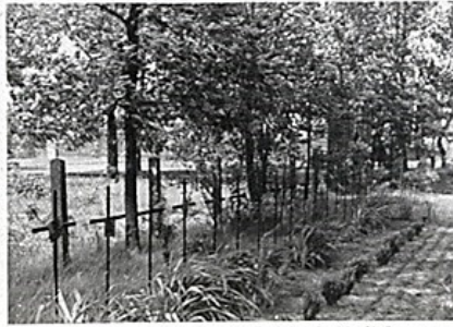
Cmentarz w Grocholicach. Fragment zbiorowych mogił poległych obrońców Gór Baranowskich.