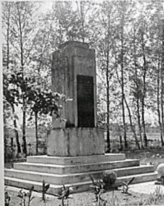
Cmentarz w Grocholicach. Pomnik ku czci poległych obrońców Gór Baranowskich. W głębi widoczne krzyże zbiorowych mogił.