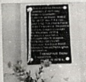
Tablica pamiątkowa 2 p.p. Leg. umieszczona w klasztorze O.O. Karpowicz w Zakroczymiu.