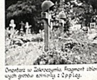
Cmentarz w Zakroczymiu. Fragment zbiorowych grobów żołnierzy z 2 p.p. Leg.