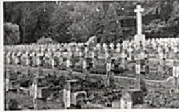
Cmentarz w Olsztynie. Widok masowych grobów - mogił żołnierzy z 2 p.p. Leg.