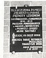
Pamiątkowa tablica 2 p.p. Leg. w kościele św. Józefa w Sandomierzu.