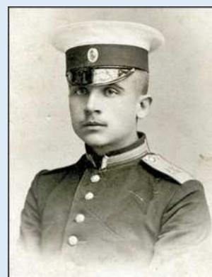
Petersburg 1909 Absolwent Mikołajowskiej Szkoły Inżynierii

Od lutego do kwietnia tego roku był zastępcą dowódcy oddziału lotniczego.