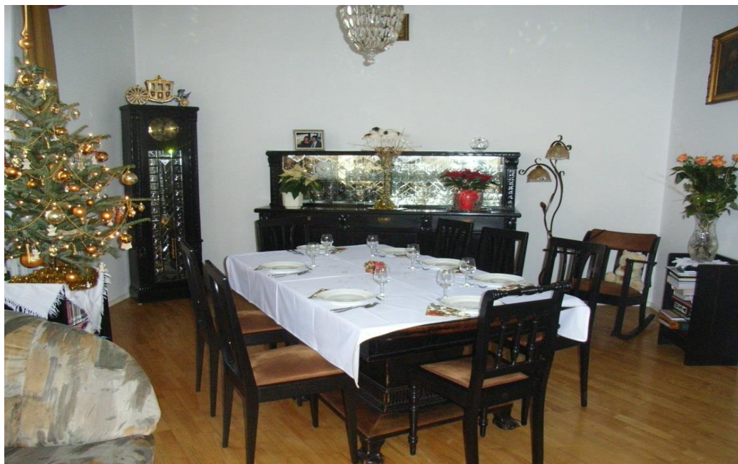
Pokój stołowy – grudzień 2007r.