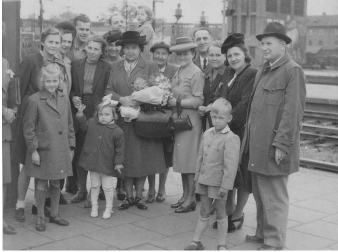
Powitanie Cioci Kate po powrocie z USA