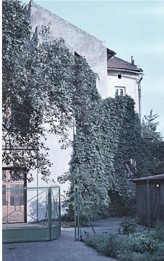
Widok domu w 1971r.