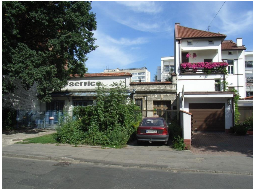
Widok domu po przebudowie w 2006r. Po lewej stronie dawny warsztat Stryja Zdzisława