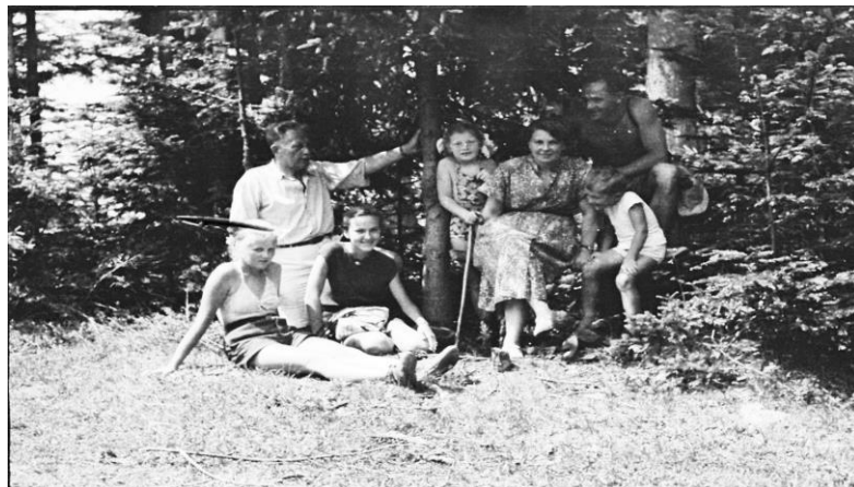
Wakacje - Prawdopodobnie 1953r.