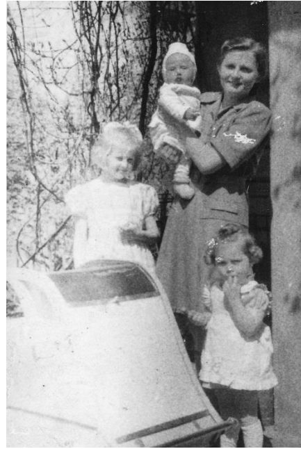
Miechowska kwiecień 1948r.