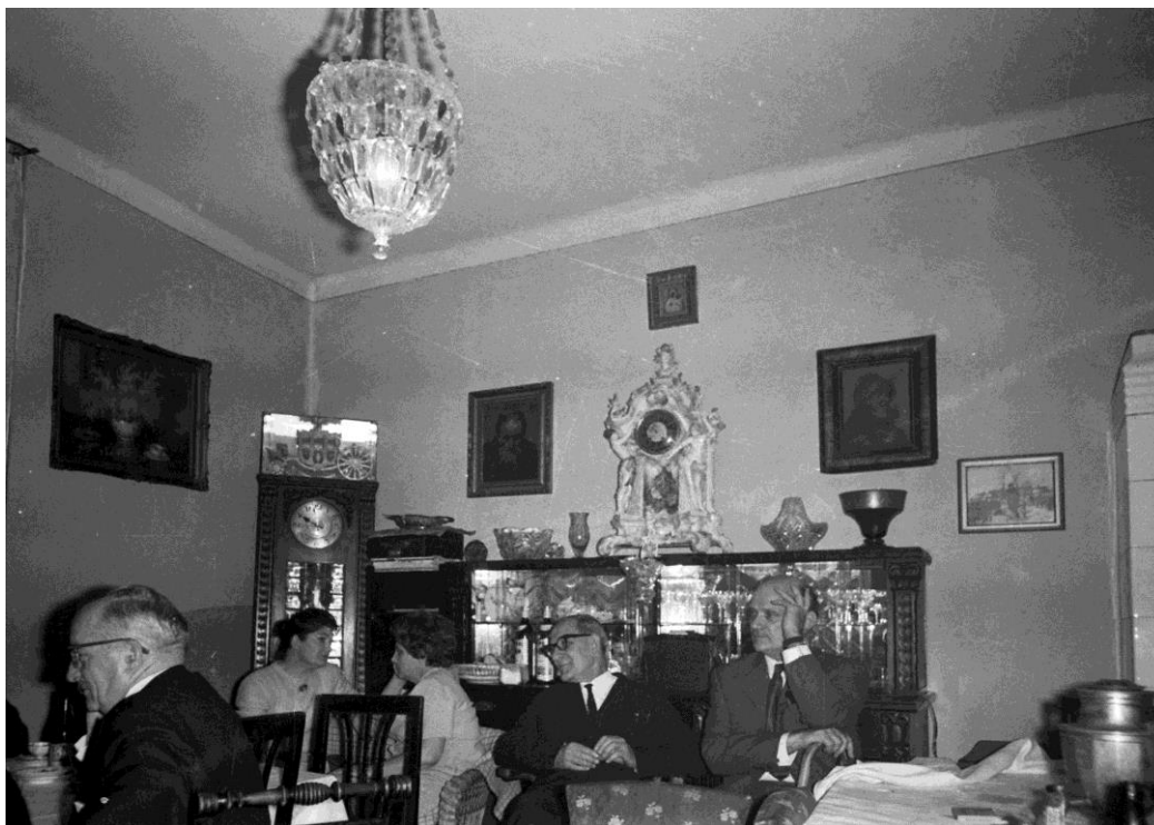
Pokój stołowy na Michowskiej w 1971r.