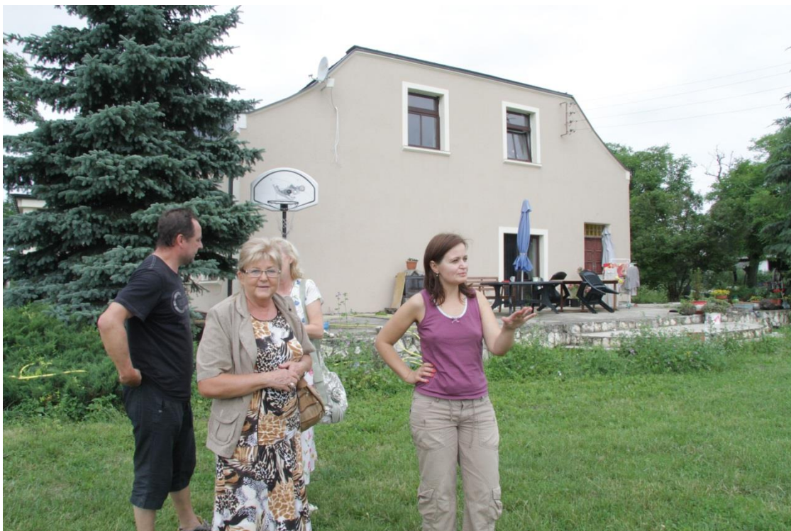
Bukowno2011r. - obecni właściciele PP Żurkowie z autorką wspomnień