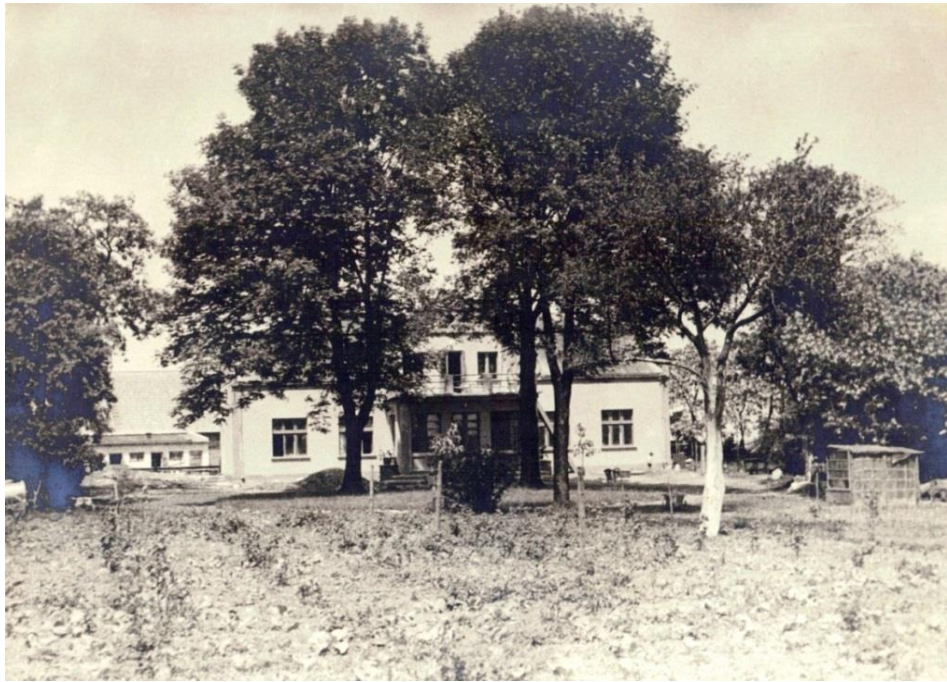
Bukowno – jeszcze dwa jesiony

Przed gankiem rosły dwa duże jesiony okolone klombem z podjazdem pod sam dom. Na ganku czekał na gospodarzy ukochany pies Ojca bernardyn Reks, który w czasie wejścia wojsk radzieckich zginął od zbłąkanej kuli.