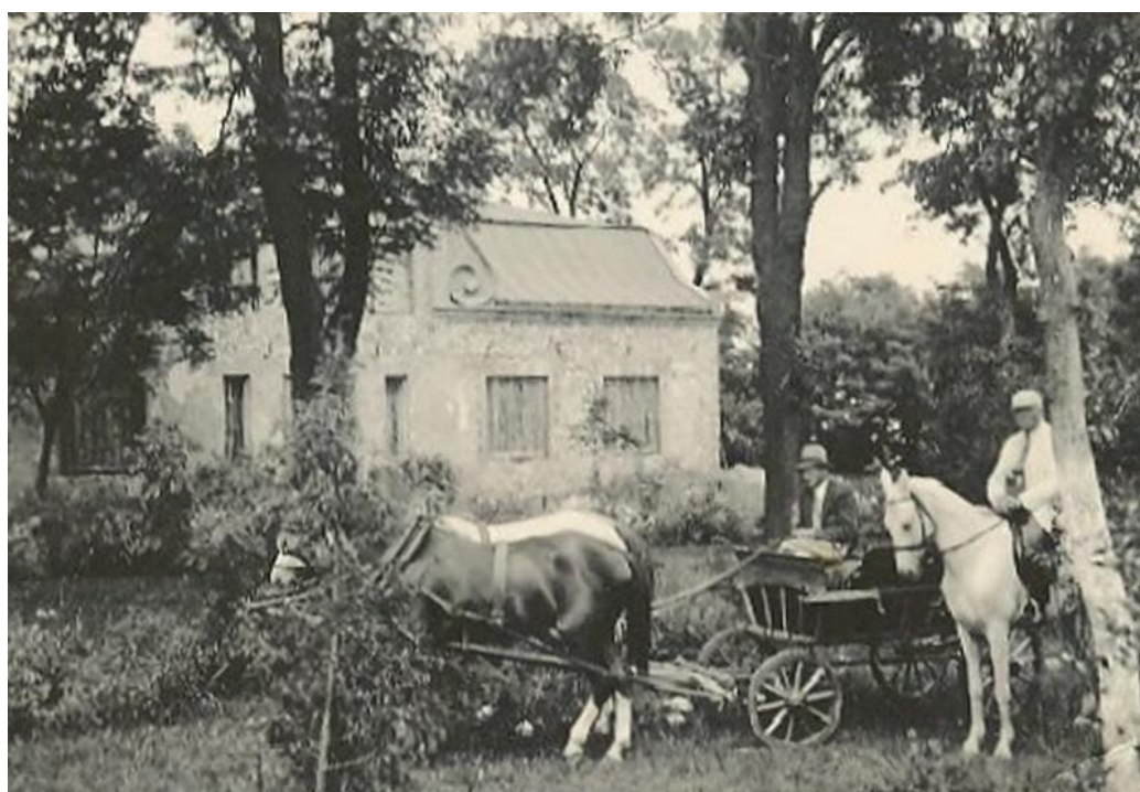
Bukowno w budowie