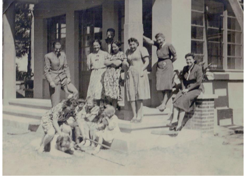
Bukowno 1943r. - rodzina