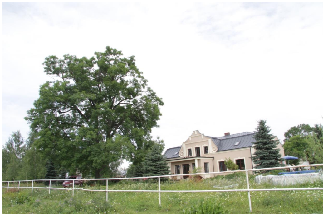
Bukowno 2011r. Już jeden jesion