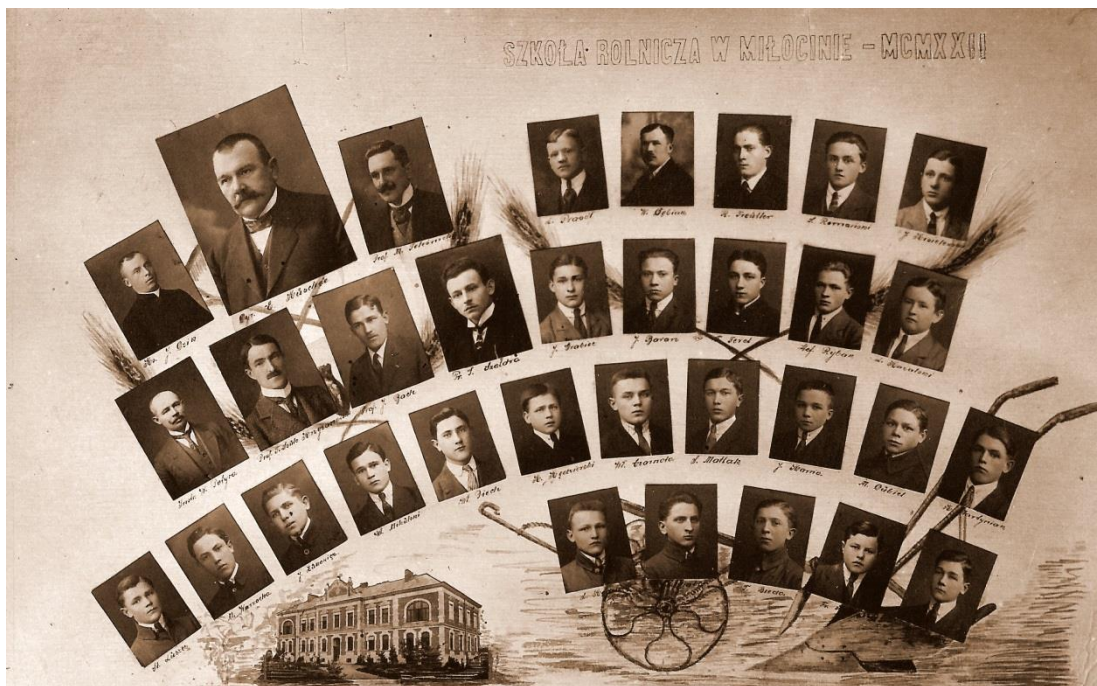
Tableau szkoły Rolniczej w Miłocinie - 1922 r.